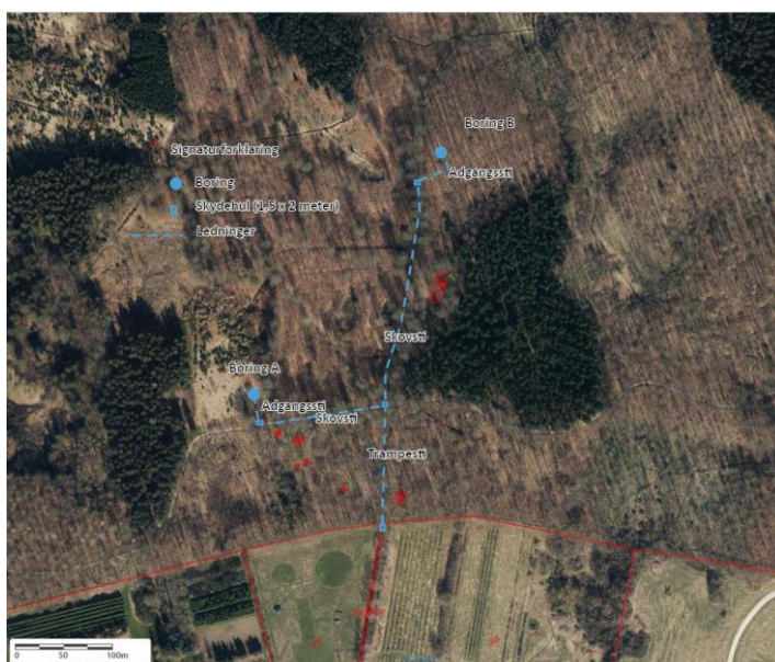
Skitse af borerne, adgangssti samt skydehul.

Efter borearbejdet mv. etableres ledningsforbindelser dybere end 1,5 meter under terræn ved horisontalt retningsstyrende underboring. Ledninger bores fra skydehul til skydehul. Der vil ydermere blive etableret to meter bred adgangssti af grus til borerne (markeret på nedenstående kort).