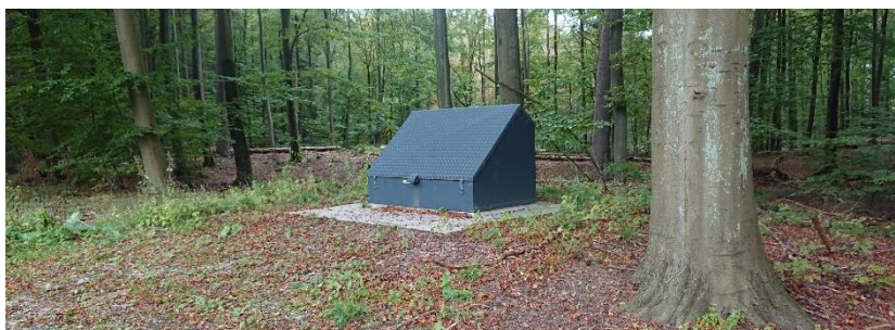
Eksempel på en råvandsstation.

Det ansøgte projekt omfatter en boring med dertilhørende råvandsstation i en mørkegrøn farve. Det ansøgte har et grundplan på 2,4 x 1,2 meter og en højde på 1,5 meter. Et eksempel på dette fremgår på nedenstående billede.